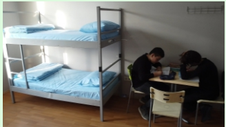
4 Kişilik Öğrenci Odalarımız

Adres: FATİH MAH. ÖZGÜRLÜK CAD. NO: 4 BERGAMA / İZMİR Telefon: (232) 631 2867 https://bergamaih1.meb.k12.tr